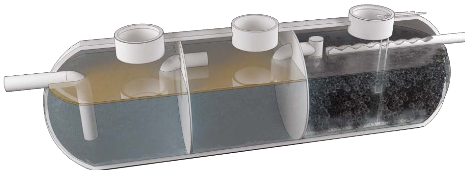
Filtro biológico compacto anaerobico